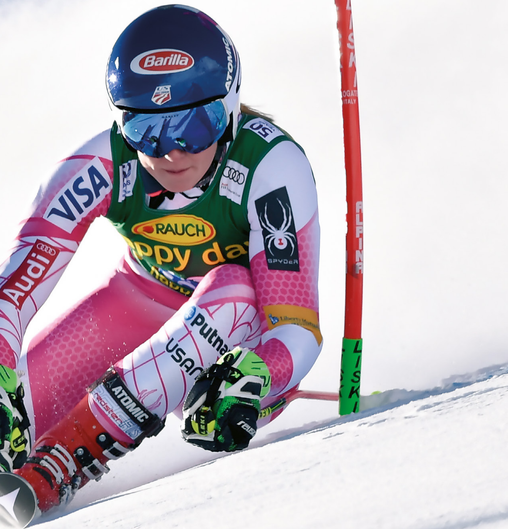
Mikaela Shiffrin 2016 auf dem Rettenbachferner, Sölden