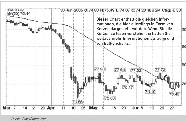
Abbildung 2: Kerzenchart IBM