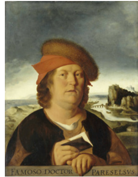
Portraits von Machiavelli, Pareto und Paracelsus