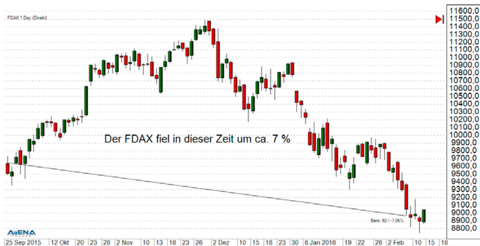
Abbildung 2: DAX-Performance Oktober 2015 bis 15. Februar 2016

1. Oktober 2015 und dem 15. Februar 2016 habe ich meinen Handelsansatz im Rahmen einer Webinar-Reihe live vorgestellt. Dazu habe ich ein Depot mit 5.000 Euro kapitalisiert und in dieser Zeit real gehandelt, um meine Strategie zu verdeutlichen. Währenddessen zeigte sich ein ganz »normaler« Kursverlauf mit unterschiedlichen Phasen, die Märkte sind sowohl stark angestiegen als auch deutlich eingebrochen. Meine Strategie musste also mit jedem Umfeld zurechtkommen. Wie dies gelungen ist, verdeutliche ich an den 13 Trades aus dem Zeitraum vom 1. Oktober 2015 bis zum 15. Februar 2016. Beginnend mit Nummer eins werde ich alle Transaktionen in chronologischer Folge vorstellen. Sie finden alle Angaben zu Preisen, Gebühren und natürlich zur jeweiligen Performance. Doch ohne vorgreifen zu wollen, zeigt sich bereits eine wichtige Erkenntnis: Wenige Transaktionen reichen aus für die Strategie hinter diesem Buch. Ich habe durchschnittlich nur einmal pro Woche gehandelt. Sie werden jeweils erfahren, unter welchen Voraussetzungen eine Transaktion stattfand, welche Absicht dahinterstand und inwiefern mein jeweiliger Plan aufgegangen ist.