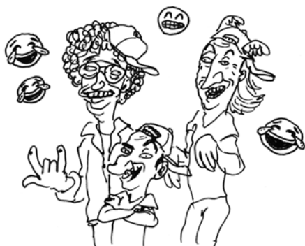
DAS SPAß-FEATURE MIT DEUTSCHEM SAT1/YOUTUBE COMEDIAN