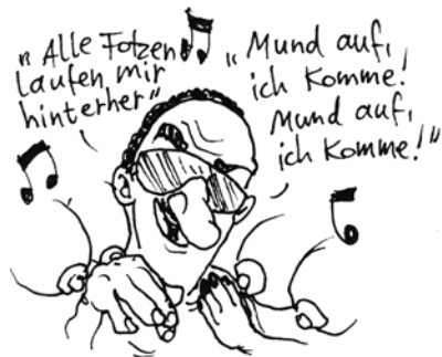
DER PROVOKANTE TRACK