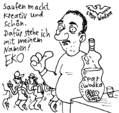
WERBUNG FÜR RANDOM PRODUKT, UM ALIQUOTVERLUSTE WIEDER REINZUHOLEN