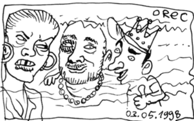
17000 BARS KARRIERE RÜCKBLENDE