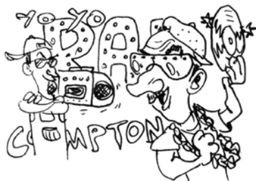
DER OLDSCHOOL RAP-PRESENTER