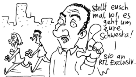
DER ERNSTE SONG ÜBER DIE TRAGISCHEN GESCHEHNISSE VORIGER WOCHE